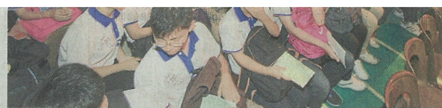
▲柔佛州内多所独中华乐团团员都聚集新山，一睹新加坡华乐团的风采。