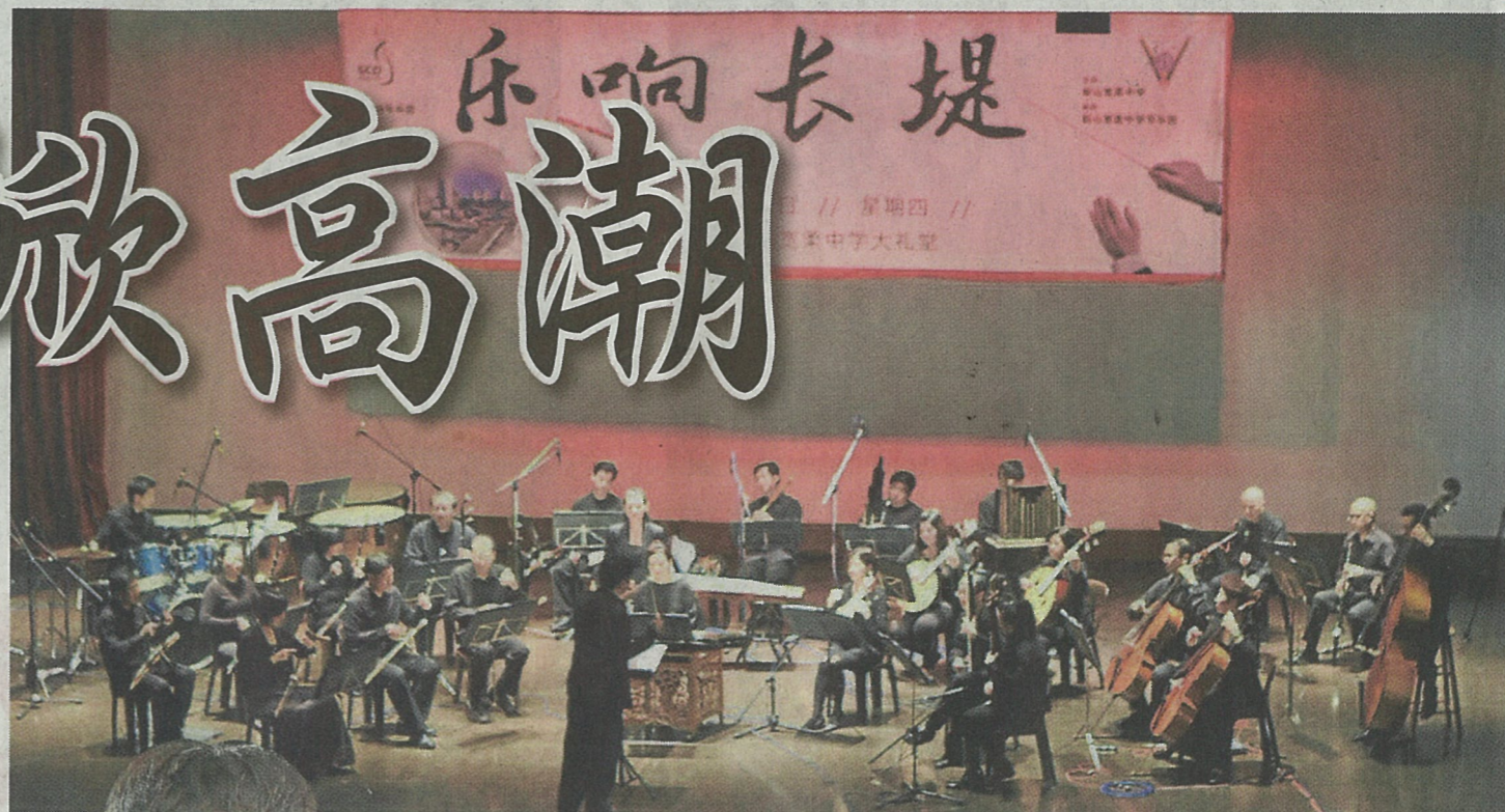
▲新加坡华乐团首次越过长堤,把马来西亚首演献给新山,让本地华乐迷一饱耳福。

新加坡华乐团自1997年成立以来,昨晚首次跨越长堤到我国演出,在新山宽柔中学大礼堂为本地乐迷呈献《乐响长堤》音乐会。